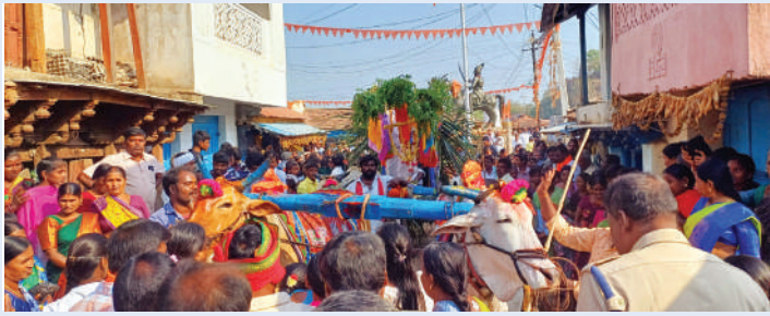
గ్రామ ప్రజలు ప్రత్యేక పూజలు

పాపన్నపేట, ఫిబ్రవరి 27 (జనంసాక్షి): చారిత్రాత్మక ఘట్టం ఆవిష్కృతమైంది. మెదక్ జిల్లా ఏడుపాయల వనదుర్గము క్షేత్రంలో మూడు రోజులు మహాశివరాత్రి జాతర ఉత్సవాలు వైభవంగా జరుగుతున్నాయి. ఈ సందర్భంగా రెండవ రోజు గురువారం ఉదయం పాపన్నపేట సంస్థాన్ బండి ఏడుపాయలకు తరలి వెళ్ళింది. గ్రామ ప్రజలు భక్తి శ్రద్ధలతో ప్రత్యేక పూజలు చేశారు. పోలీస్ శాఖ సిబ్బందితో బందోబస్తా కల్పించింది. అనవాయితీ ప్రకారం ఏడుపాయల మహావన జాతరలో ఈ బండి ముందు వరుసలో ఉంటుంది. మిగతా జోడేడ్ల బండ్లు దీనిని అనుసరిస్తాయి.