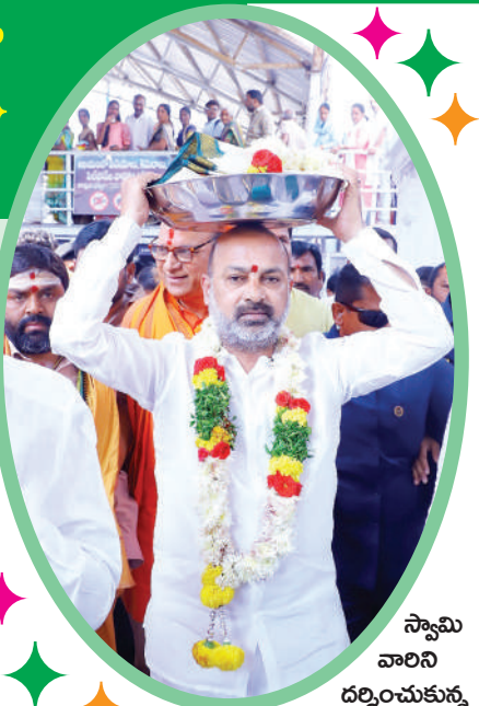
స్వామి వారిని దర్శించుకున్న

రాజన్నను దర్శించుకున్న కవిత .. ఉత్సవాలను పరిశీలించిన ప్రభుత్వ విప్ ఆది