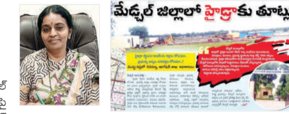
మేడ్చల్ జిల్లాలో హైద్రాకు తూట్లు