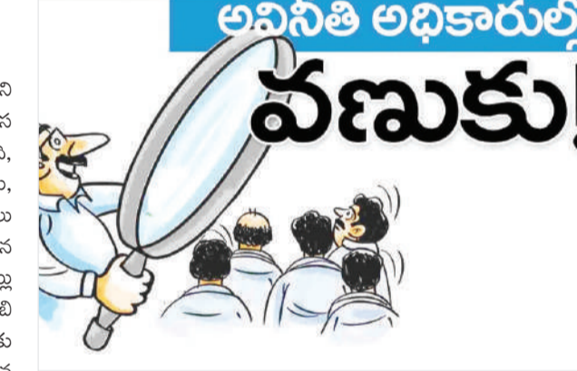
కోట్లు కూడా పెట్టిన ఏడో ఒక రోజు వారి బంధారం బయటపడుతుందని మండల వాసులు చర్చించుకుంటున్నారు, పూర్తి ఆధారాలతో మరో కథనంతో మీ ముందుకు జనం సాక్షి.

మర్రిగూడ, ఫిబ్రవరి 17 (జనంసాక్షి) : మర్రిగూడ మండలంలోని కొంతమంది అవినీతి అధికారులకు గుండె దడ పట్టుకుంది, ఏసీబీ వరస దారులతో గత చరిత్రను తలుచుకొని అధికారులకు భయం పట్టుకుంది, ప్రజల రక్త మాంసాలను తిని కోట్లాది పాత్రినీ ఆ అవినీతి అధికారులు, కొన్ని శాఖలలో భారీ స్థాయిలో అవినీతి జరిగిందని మండల వాసులు చర్చించుకుంటున్నారు, గత 5 ఏళ్లలో మర్రిగూడ మండలం పనిచేసిన అధికారులు భారీ మొత్తంలో లంచాలు తీసుకుని ఆస్తులు కూడా పెట్టినట్లు ఆరోపణలు వస్తున్నాయి, గతంలో జరిగిన అవినీతిపై కూడా ఏసీబీ అధికారులు దృష్టిసాదించినట్లు తెలుస్తుంది, దీంతో అధికారులకు నిద్రాపరాలు కరువయ్యాయి, గతంలో మర్రిగూడ మండలంలో పనిచేసిన కొంతమంది అవినీతి అధికారులపై కూడా ఫిర్యాదులు అందినట్లు తెలుస్తుంది, తిమింగలాలను వదిలి పరకాలపై దాడులు జరుగుతున్నాయని నిద్రాపరాలు కరువయ్యాయి, ఏసీబీ దాడులతో అవినీతి సామ్యంతో