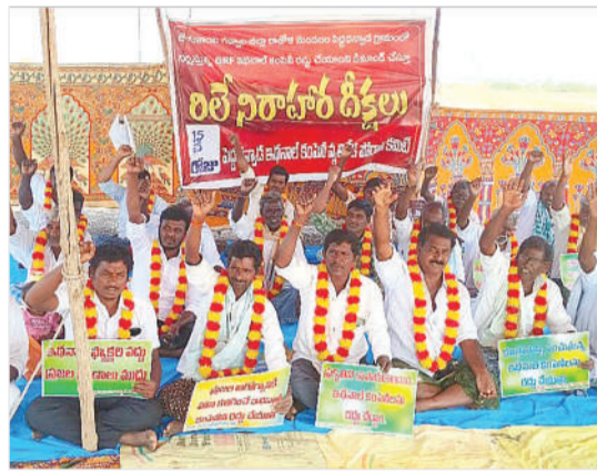
రాజీవ్, ఫిబ్రవరి 06 (జనంసాక్షి) : పెద్ద ధన్యాడ గ్రామ శివారులో నిర్వహించిన ఇథనాల్ నిర్మాణ పనులు రద్దు చేయాలని