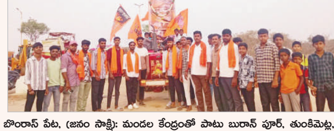
బొంరాన్ పేట, (జనం సాక్షి): మండల కేంద్రంతో పాటు బురాన్ పూర్, తుంకిమెట్ల, గ్రామాల్లో హిందు వాహినీ, ఆర్ఎన్ఎస్ ఆధ్వర్యంలో కమ్మల పండుగగా శోభాయాత్ర నిర్వహించారు. ఎలాంటి అవాంఛనీయ సంఘటనలు జరగకుండా పోలీసులు ఆయా గ్రామాల్లో బందోబస్తు నిర్వహించారు.