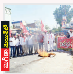
మిగిలా మొయిన్ లో