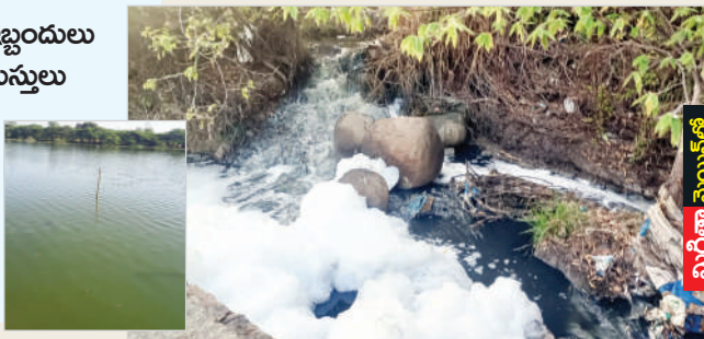
మిగిలా మొయిన్ లో

రంగారెడ్డి జిల్లా షాద్ నగర్ పట్టణ మున్సిపాలిటీలోని వివిధ కాలనీల నుండి బయటికి వెళ్లే మురుగు నీటిని గతం నుండి పట్టణానికి ఆసుకొని ఉన్న జానమ్మ చెరువులోకి వదిలేవారు పెద్ద ఎత్తున వర్షాలు పడినప్పుడు చెరువు నుండి అలుగు ద్వారా వర్షం నీరుతో పాటు మురుగు నీరు బయటకు వెళ్లిపోయేది కానీ ప్రస్తుతం షాద్ నగర్ పట్టణంలోని వివిధ కాలనీల ద్వారా సిఎస్కే వెంచర్ నుండి నందిగామ మండలం అప్పారెడ్డిగూడా గ్రామ శివారులో ఉన్న చెరువులోకి పోయే విధంగా దారి మళ్లించారు.