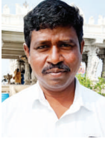
నాలుగు రోజులపాటు ప్రత్యేక పూజా కార్యక్రమాలు సముద్రాల సుదర్శన చార్యులు, ఆలయ ప్రధాన అర్చకులు, లింగగిరి. ఈనెల