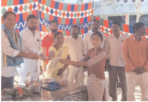
అందిస్తున్నట్లు తెలిపారు. విజేతలకు బహుమతులు అందజేశారు. ఈ కార్యక్రమంలో మండల నాయకులు కార్యకర్తలు పాల్గొన్నారు.

పాల్గొన్నారు. ఈ సందర్భంగా ఈ సందర్భంగా ఆయన మాట్లాడుతూ విద్యార్థులు క్రీడల్లో రాణిస్తే జీవితంలో ఎంత పెద్ద ఇబ్బందులు వచ్చిన ధైర్యంగా ఎదుర్కొంటారని, క్రీడలతో మానసిక ఉల్లాసం, శారీరక దృఢత్వం లభిస్తుందని, ముఖ్యమంత్రి రేవంత్ రెడ్డి క్రీడలకు అత్యంత ప్రాధాన్యత ఇస్తున్నారని, రానున్న ఒలింపిక్ పోటీల్లో పాల్గొనడానికి రాష్ట్రంలో స్పెషియల్ యూనివర్సిటీ ప్రారంభించడం జరుగుతుందని, సిఎం కవ్ తో గ్రామీణ స్థాయి క్రీడాకారులను వెలికితీసి వారికి ప్రోత్సాహం