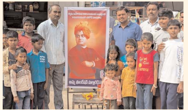
వీణవంక మండలంలోని మల్లారెడ్డిపల్లి గ్రామంలోని అమ్మ ఫౌండేషన్ మల్లారెడ్డిపల్లి వారి ఆధ్వర్యంలో స్వామి వివేకానంద చిత్రపటానికి పూలమాల వేసి 162 వ జయంతి వేడుకలను ఘనంగా నిర్వహించి స్వీట్లు పంపిణీ చేసినారు.