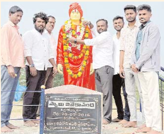
సైదాపూర్ మండలంలోని సోమవరం ఆదర్శ పాఠశాల ఆవరణలో బీజేపైఎం ఆధ్వర్యంలో స్వామి వివేకానంద విగ్రహానికి పూలమాల విసి నివాళులర్పించారు. స్వీట్లు పండ్లు పంపిణీ చేశారు.