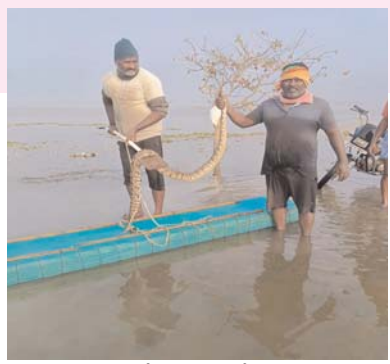
సూచిస్తున్నారు. చేపల వలలో చిక్కుకుంటున్న కొన్ని పాములు మృతి చెందుతున్నాయని, మరికొన్నింటిని ప్రాణాలతో ఒడ్డుకు తీసుకువచ్చి విడిచిపెడుతున్నామని తెలిపారు. ప్రతిరోజు పాములతో సావాసాలు చేస్తూ చేపలు పట్టడం కత్తి మీద సాములా మా జీవనం కొనసాగుతుందని ఆవేదన వ్యక్తం చేశారు.

తెలిపారు. గత వారం రోజుల నుండి చేపల కోసం వేసిన వలలో రోజుకు ఒకటి రెండు కొండచిలువ పాములు పడుతున్నాయని వాటిని తొలగించేందుకు తీవ్ర ఇబ్బందులు ఎదుర్కొంటున్నామని పేర్కొన్నారు. ఆదివారం రోజున సుమారు 7 ఫీట్ల పొడవు, 10 కేజీల పైన బరువు ఉందని తెలిపారు. చేపలు పడడం ఒక్కేత్తు అయితే ఈ కొండచిలువలను వలలో నుండి తొలగించడం మరొక్కేత్తు అవుతుంది. వీటిని తీసే క్రమంలో కొండచిలువ పాములు మా పై దాడి చేస్తున్నాయని ఒంటరిగా వెళ్లే జాలర్లు అప్రమత్తంగా ఉండి ఈ పాములను వలల నుండి తొలగించాలని జాలర్లకు