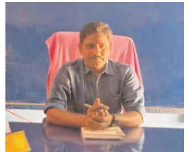
విద్యార్థులకు కేటాయించిన కేంద్రాలలో నిర్వహించబడుతుందని తెలిపారు.

సంస్థ విడుదల చేసిందన్నారు. దీనిలో భాగంగా ప్రస్తుతం 4వ తరగతి చదువుతున్న విద్యార్థులు మీసేవ లేదా ఇంటర్నెట్ కేంద్రాలలో ఆధార్ కార్డు, బోనఫైడ్ సర్టిఫికేట్/ బర్త్ సర్టిఫికేట్, పాస్ ఫోటో, కుల, ఆదాయ ధ్రువీకరణ పత్రం, మొబైల్ నెంబర్ తో రూ.100 పరీక్ష ఫీజు రుసుముతో దరఖాస్తు సమర్పించాలని తెలిపారు. దానికి తుది గడువు 01.02.2025 వరకు ఉందని అలాగే రాష్ట్ర వ్యాప్తంగా ఉమ్మడి ప్రవేశ పరీక్ష 23. 02. 2025 ఉదయం 11 గంటల నుండి మధ్యాహ్నం ఒంటిగంట వరకు