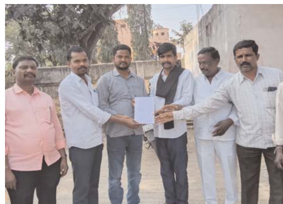
లక్ష డబ్బులు వేయి గొంతులకలు కార్యక్రమాన్ని