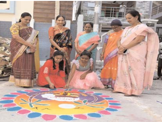
సూర్యాపేటలోని జయ పాఠశాలలో ఘనంగా ముగ్గుల పోటీలు