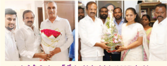
(జనంసాక్షి): హైదరాబాద్ లో నూతన సంవత్సరం(2025) సందర్భంగా మాజీ మంత్రి, సిద్దిపేట ఎమ్మెల్యే హరీష్ రావు, ఎమ్మెల్యే కల్వకుంట్ల కవిత లను దేవరకల్ల మాజీ ఎమ్మెల్యే ఆల వెంకటేశ్వర్ రెడ్డి మర్యాద పూర్వకంగా కలిసి నూతన సంవత్సర శుభాకాంక్షలు తెలిపారు.