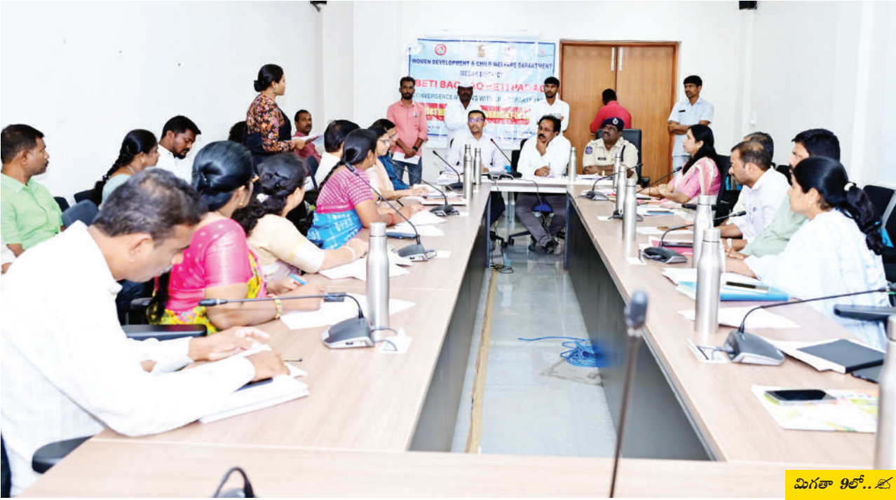
మిగతా 9లో.. ౬