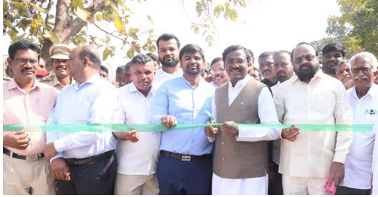
నిర్మల్ బ్యారో, జనవరి 07 (జనంసాక్షి)