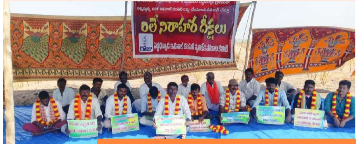
మూడవరోజు నిరాహార దీక్షలో పాల్గొన్న ఆయా గ్రామాల రైతులు