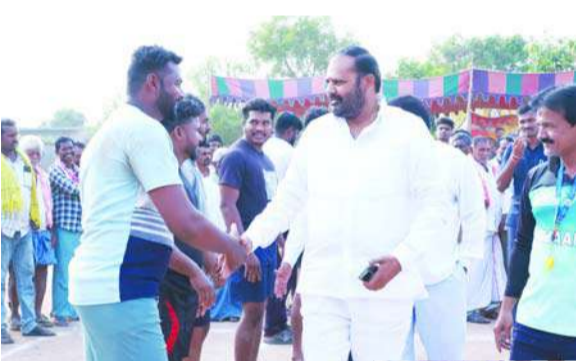
పెద్దపల్లి ఎమ్మెల్యే విజయరమణ రావు పెద్దపల్లి, జనవరి 15 (జనంసాక్షి)