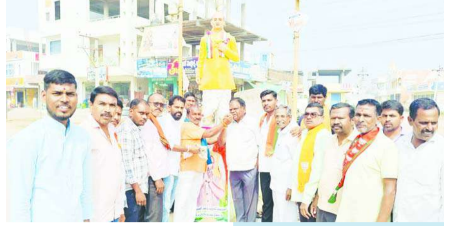
రాయకల్ జనవరి (జనం సాక్షి):