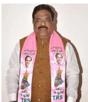
నాగరకర్నూల్ (జనం సాక్షి) : మూడే ఎంపీ మందా జగన్నాథం అంత్యక్రియలను అధికారిక లాంఛనాలతో నిర్వహించాలని ప్రభుత్వం నిర్ణయించింది. నాగరకర్నూల్ మూడే ఎంపీ మందా జగన్నాథం