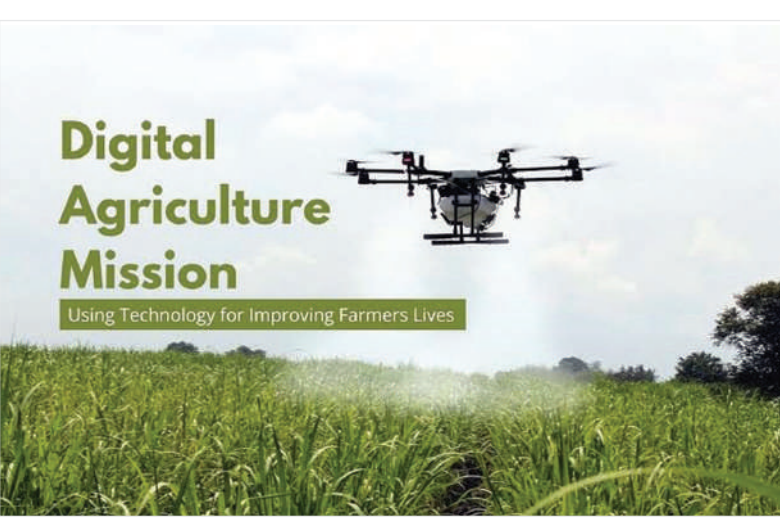
Digital Agriculture Mission Using Technology for Improving Farmers Lives

డిజిటల్ విప్లవాన్ని వ్యవసాయానికి విస్తరించడం ద్వారా, ఆర్థిక వ్యవస్థలోని క్లిష్టమైన రంగాలకు వివాదాత్మక, సాంకేతికతతో సడదీసే పరిష్కారాలలో ప్రపంచంలో అగ్ర స్థానాన్ని మరింత పటిష్టం చేసుకోవాలని మనదేశం లక్ష్యంగా పెట్టుకుంది. రైతులకు ఆదాయ మద్దతును పెంచడం ద్వారా రైతుల సంక్షేమం కోసం భారత ప్రభుత్వం చేపట్టిన వివిధ పథకాలు, కార్యక్రమాలు, దేశంలో వ్యవసాయం వేగంగా, విస్తృతంగా అభివృద్ధి చెందడానికి కేంద్ర ప్రభుత్వం అనేక కార్యక్రమాలు చేపట్టింది. అందులో డిజిటల్ అగ్రికల్చర్ మిషన్ ఒకటి. డిజిటల్ గుర్తింపు, సురక్షిత చెల్లింపులు, లావాదేవీలు దేశంలోని డిజిటల్ విప్లవానికి కొత్త బాటలు వేయాయి. ఇటీవలి సంవత్సరాల్లో పాలన తీరును, సేవా పంపిణీ వ్యవస్థను గణనీయంగా మార్చారు. ఈ పురోగతి ఆర్థిక, ఆరోగ్య సంరక్షణ, విద్య, రిటైల్లో సహా వివిధ రంగాలలో అభివృద్ధి చెందుతున్న డిజిటల్ విస్తారిత వ్యవస్థలకు మార్గం సుగమం చేసింది. పౌర కేంద్రీకృత డిజిటల్ పరిష్కారాలలో భారతదేశాన్ని అగ్రగామిగా నిలిపింది. ఈ పరివర్తన క్రమంలోనే ప్రధాన మంత్రి నరేంద్ర మోడీ ఆధ్వర్యంలో గత సెప్టెంబర్ నెల 2వ తేదీన జరిగిన కేంద్ర మంత్రివర్గ కమిటీ గణనీయమైన ఆర్థిక వ్యయం రూ.2,817 కోట్లతో 'డిజిటల్ అగ్రికల్చర్ మిషన్'కు ఆమోదం తెలిపింది. ఇందులో కేంద్ర ప్రభుత్వ వాటా రూ. 1,940 కోట్లు.