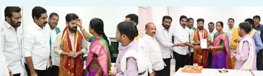
రావాలంటూ సీఎం రేవంత్ కు మంత్రి కొండా సురేఖ విజ్ఞప్తి