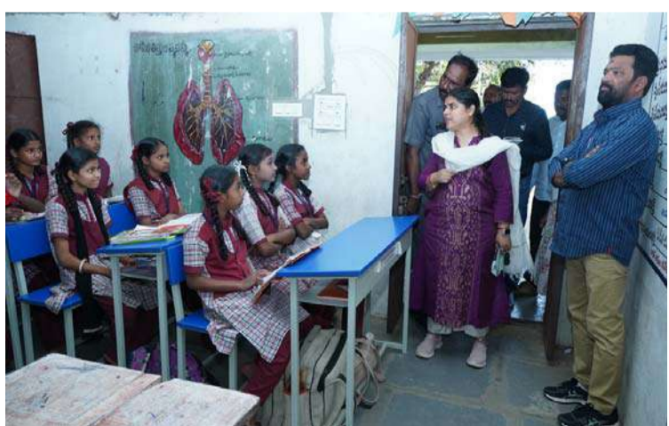
వరంగల్ ప్రతినిధి, జనవరి 8 (జనంసాక్షి)