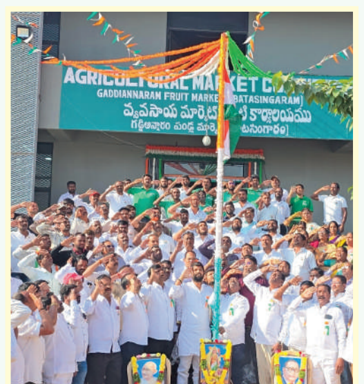
జిల్లా బిఆర్ఎస్ పార్టీ కార్యాలయంలో జాతీయ జెండాను ఆవిష్కరించిన మండల అధ్యక్షులు.