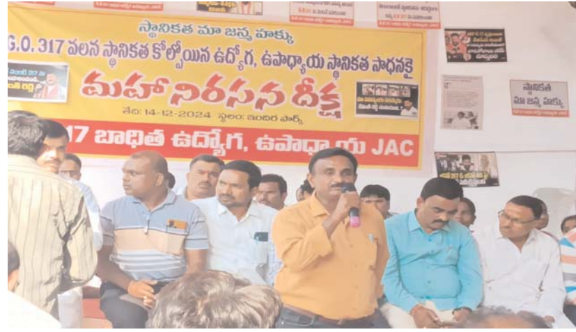
లో టి యు టీ ఎఫ్ ముందుండి పోరాటం చేస్తుందని హామీ ఇస్తూ, జి ఒ 317 బాధిత ఉద్యోగులకు మాత్రమే కాకుండా నిరుద్యోగులకు కూడా ఉద్యోగ అవకాశాలు దెబ్బతింటాయని, ఎక్కువగా ఉన్న జిల్లాలలో ఉద్యోగ ఖాళీలు చాలా తక్కువగా ఉంటాయని కాబట్టి దీనిపై నిరుద్యోగులు కూడా ఉద్యమించే రోజులు రాకుండా స్వంత ప్రదేశాలకు పంపించాలని

భువనగిరి కలెక్టరేట్ ,డిసెంబర్ 14 ( జనం సాక్షి) ఎలాంటి కాలయాపన చేయకుండా, బాధిత ఉద్యోగి ఉపాధ్యాయులను సాంత ప్రదేశాలకు పంపించాలని, టియూటిఎఫ్ రాష్ట్ర ప్రధాన కార్యదర్శి లచ్చు మల్ల వెంకన్న డిమాండ్ చేశారు. 317 బాధిత ఉద్యోగి-ఉపాధ్యాయ మహా ధర్నా ఇందిరా పార్క్ ధర్నా శిబిరం లో మద్దతు ప్రకటించి మాట్లాడుతూ స్థానికులు స్థానికతను కోల్పోయేటట్లు చేసిన జీవో 317 ను వెంటనే ఉప సమహరించుకొని బాధిత ఉద్యోగిస్థుల ను తమ స్వంత జిల్లాలకు ఎలాంటి షరతులు లేకుండా పంపించాలని కోరారు. 317 పై వేసిన మంత్రుల కమిటీ నివేదికను బయట పెట్టాలన్నారు. స్థానికతను కోల్పోయిన ఉద్యోగ - ఉపాధ్యాయులు అనేక భాదలకూ గురి అవుతున్నారని, గత ప్రభుత్వం తీసుకొచ్చిన జి ఒ ను ప్రతి పక్షపార్టీ నాయకుడిగా ఉన్నప్పుడు రద్దు చేస్తానని చెప్పిన నేటి ముఖ్యమంత్రి రేవంత్ రెడ్డి రద్దు చేసి ఎలాంటి కాలయాపన లేకుండా బాధిత ఉద్యోగి ఉపాధ్యాయ స్వంత ప్రదేశాలకు పంపించాలి అన్నారు. అదే విధంగా భవిష్యత్ లో బాధిత ఉద్యోగ మిత్రులు చేసే ప్రతి కార్యక్రమం