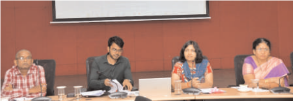
చేసిన నిబంధనల ననుసరించి నిర్వహించాలని అన్నారు. జిల్లాలో డిసెంబర్ 15,16 తేదీల్లో గ్రూప్-2 పరీక్షలు నిర్వహించేందుకు 54 పరీక్ష కేంద్రాలను ఏర్పాటు చేయడం జరిగిందని, మొత్తం 20584 మంది అభ్యర్థులు పరీక్షకు హాజరు కానున్నట్లు ఆమె తెలిపారు. ఈ సమావేశం లో స్థానిక సంస్థల అదనపు కలెక్టర్ శివేంద్ర ప్రతాప్ తదితరులు పాల్గొన్నారు.

మహబూబ్ నగర్ బ్యూరో (జనం సాక్షి) : గ్రూప్-2 పరీక్షలు సజావుగా నిర్వహించేందుకు అన్ని ఏర్పాట్లు చేయాలని జిల్లా కలెక్టర్ విజయేంద్ర బోయి అధికారులను ఆదేశించారు. మంగళవారం కలెక్టరేట్ లోని సమావేశ మందిరంలో డిసెంబర్ 15,16 తేదీల్లో నిర్వహించే గ్రూప్-2 పరీక్షల నిర్వహణపై రీజియన్ల కో ఆర్డినేటర్ లు, డిప్యూటీ సెక్షన్ అధికారులు, రూల్ అధికారులు, ప్లయింగ్ స్టాఫ్, ఐడెంటిఫికేషన్ అధికారులతో సమావేశం నిర్వహించి తెలంగాణా పబ్లిక్ సర్వీస్ కమిషన్ జారీ చేసిన నిబంధనల పై అవగాహన కలిగించారు. గ్రూప్ 2 పరీక్షలలో ఎటువంటి పొరపాట్లకు ఆస్కారం లేకుండా జాగ్రత్త గా పబ్లిక్ సర్వీస్ కమిషన్ జారీ