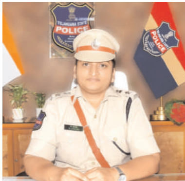
క్రిమినల్ కంపౌండ్ కేసులు, సివిల్ తగాదా కేసులు, ఆస్తి విభజన కేసులు, కుటుంబపరమైన నిర్వాహణ కేసులు, వైవాహిక జీవితానికి సంబంధించిన కేసులు, బ్యాంకు రికవరీ,