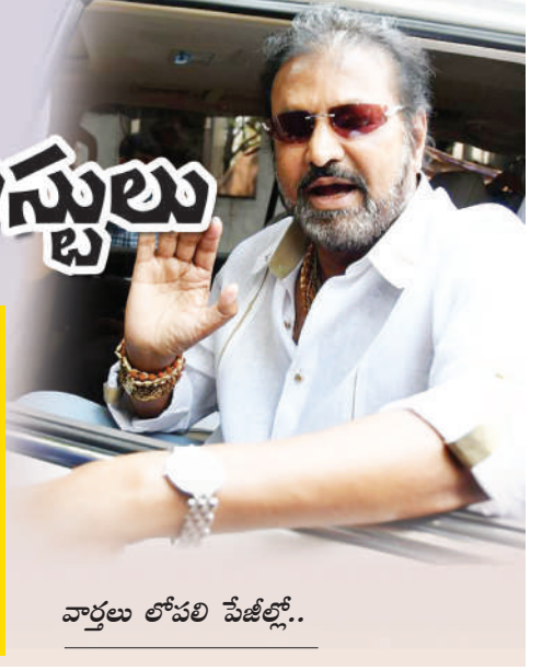
వార్తలు లోపలి పేజీల్లో..