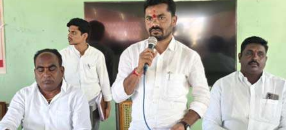
ఖానాపూర్ నియోజకవర్గ శాసనసభ్యులు వెడ్ల బొజ్జా పవిత్ర..