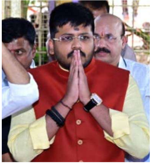
మెదక్ జిల్లా డిసెంబర్ 26 (జనం సాక్షి)

మెదక్ నియోజక వర్గం అభివృద్ధి ఏలా ఉంటుంది.. ఒక ఏడాది కాలంలోనే ప్రజలు గుర్తించేలా 780 కోట్ల రూపాయలతో అభివృద్ధి పనులకు శ్రీకారం చుట్టామని నియోజక వర్గ ఎమ్మెల్యే డా. మైనంపల్లి రోహిత్ గురువారం వెల్లడించారు. కాంగ్రెస్ ప్రభుత్వం ఏర్పడగానే ఎమ్మెల్యే గెలుపొందిన సంవత్సరంలోనే సామాజిక న్యాయం కులమతాలకు అతీతంగా సంపూర్ణంగా జరిగిందని పేర్కొన్నారు. సంక్షేమం, అభివృద్ధి పాలన మధ్య సమతుల్యత... సమగ్రంగా సాక్షి బాతం అయ్యిందన్నారు. ప్రజల హృదయాలను గెలుచుకోని ఆతి చిన్నవయస్సులో ఎమ్మెల్యే గా నేను గెలుపొందానని ఆయన గుర్తించారు. మెదక్ చరిత్ర కనిపిస్తే ఎరుగని రీతిలో 29 కోట్ల 18 లక్షల 50 వేల రూపాయలు నిధులను వందేళ్ల చరిత్ర ముఖ్యమంత్రి స్వయంగా వచ్చి ఇచ్చిన తీరును చూసి గురువులు చరిత్ర ప్రార్థనలు, ప్రసంగాలు ప్రపంచానికి వచ్చి గుడి గంటలు ద్వారా అభివృద్ధి నిసాదాలు మారుమోగాయి. అలాగే పది సంవత్సరాల కాలంలో ఒకసారిగా కూడా ఏడుపాదుల దుర్గామాతను దర్శించుకోని అనాటి మాజీ ముఖ్యమంత్రి కేసీఆర్ సిగ్గుతో తలవంచుకోవాలని ఎద్దేవా చేశారు. సాక్షాత్తు ముఖ్యమంత్రి హెయిదాబాద్ రేవంట్ రెడ్డి కావడం... 780 రూపాయల కోట్లతో శంకుస్థాపన జరిగిన తీరు మెదక్ జిల్లా చరిత్ర లో నిలిచిపోతుందన్నారు.