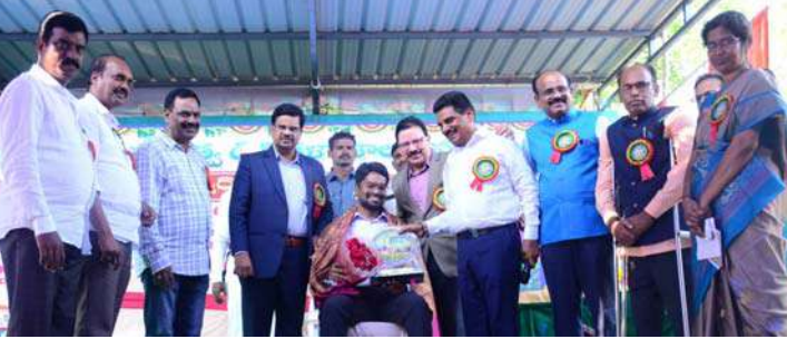
వనపర్తి బ్యూరో డిసెంబర్ 22 (జనంసాక్షి)