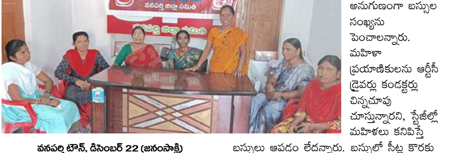
వనపర్తి బోన్, డిసెంబర్ 22 (జనంసాక్షి)