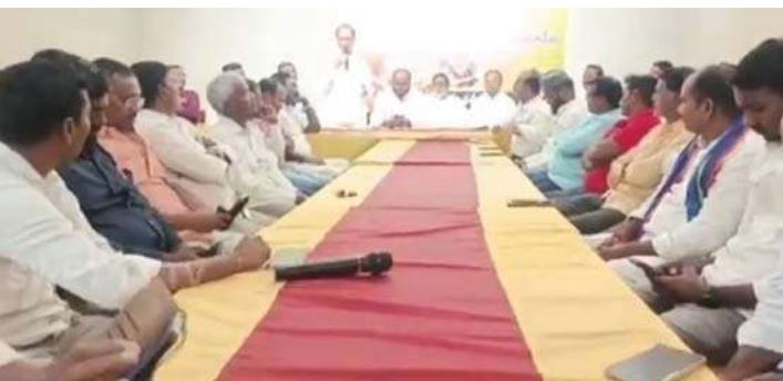
కరీంనగర్, డిసెంబర్ 22 (జనంసాక్షి)