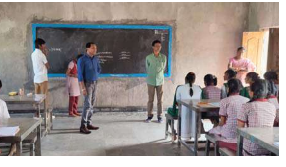
చారకొండ, డిసెంబరు 12 (జనంసాక్షి)