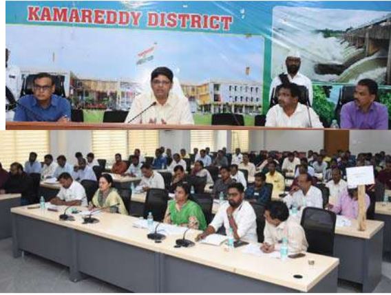
కామారెడ్డి జిల్లా ప్రతినిధి డిసెంబర్ 12 (జనం సాక్షి)