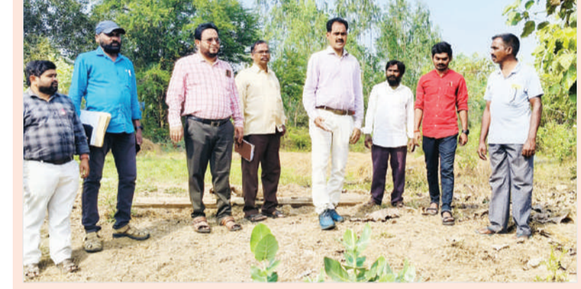
బూర్గంపహాడ్, డిసెంబర్ 12