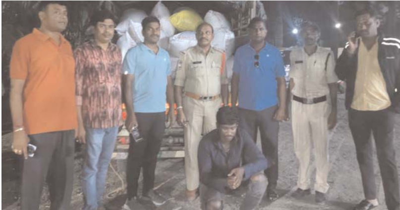
ఏపీ15టీఏ-8728 స్వాధీనం బియ్యాన్ని టాటా ఏసీ ట్రాలీ ఆటో, నిందితుడిని చేసుకున్నారు. తదుపరి విచారణ నిమిత్తం గోదావరిఖని వన్ టాన్ పోలీస్ స్టేషన్ లో స్వాధీనపరుచుకున్న 25 క్వింటాళ్ల పీడిఎస్ అప్పగించారు.