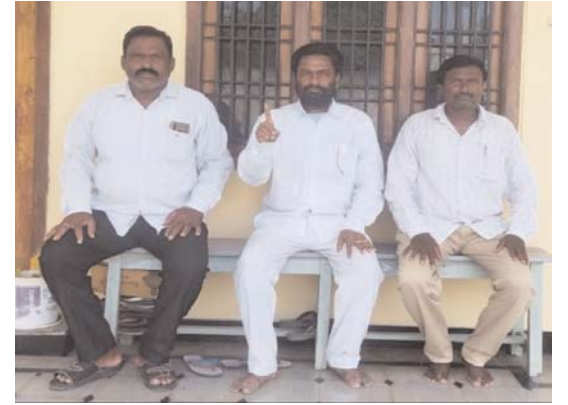
లైసెన్స్ లేకుండా ధాన్యం కొనుగోలు చేస్తే

అధికారులు బతకడానికే తప్ప వాటితో మాకు ఒరిగేదేమీ లేదన్నారు. ఈ కార్యక్రమంలో మత్స్యశాఖ అధికారులు, మత్స్య కార్మికులు తదితరులు పాల్గొన్నారు. కొనమెరుపు ఏంటంటే మత్స్యశాఖ అధికారులు వారికి నచ్చిన వారిని మాత్రమే కొంతమందిని తీసుకొని వచ్చి రిజర్వాయర్లో చేప పిల్లలను వదిలారు. ఇప్పటికైనా జిల్లా ఉన్నతాధికారులు దృష్టి పెట్టి నాసిరకం చేప పిల్లలు వదిలిన వైనంపై మత్స్యశాఖ, సదరు కాంట్రాక్టర్ పై చర్యలు తీసుకోవాలని కార్మికులు కోరుతున్నారు.