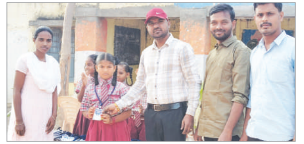
విద్యార్థులకు ఐడెంటిటీ కార్డుల పంపిణీ కృష్ణ, సవంబర్ 18