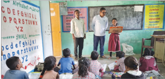
సంబంధించిన అన్ని రికార్డులను సక్రమంగా నిర్వహించాలని, కుల గణన నర్వే సకాలంలో పూర్తి చేసుకోవాలని ఉపాధ్యాయులకు సూచించారు. ఈ కార్యక్రమంలో ఆయా పాఠశాలల ప్రధానోపాధ్యాయులు, కాంప్లెక్స్ సిఆర్పిలు పాల్గొన్నారు.