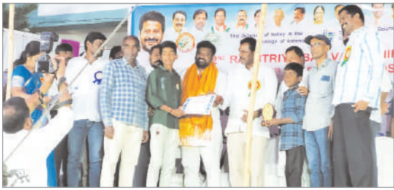
జిల్లాస్థాయి సైన్స్ ఎగ్జిబిషన్లో ప్రతిభ కనబరిచి రాష్ట్రస్థాయికి ఎంపికైన వీపనగండ్ల విద్యార్థులు