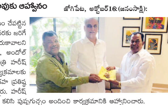
జోగిపేట, అక్టోబర్ 16: (జనంసాక్షి):