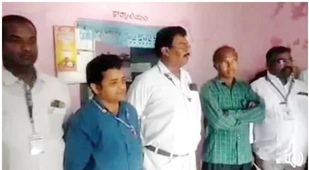
అధికారులు ఏ సమాచారాన్ని అయినా విధిగా ప్రజలకు ఇవ్వవలసిందే సమాచార కమిషనర్లను వెంటనే నియమించాలి : సి.సి.ఆర్