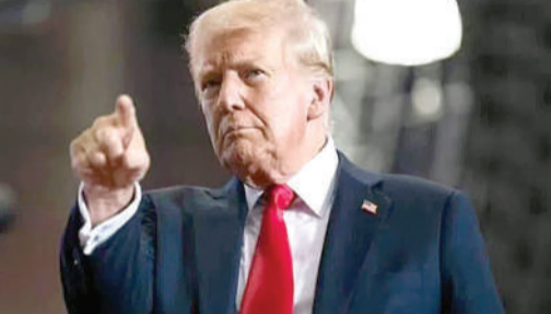
వ్యాఖ్యానించారు. ట్రంప్ వ్యాఖ్యల నేపథ్యంలో ప్రపంచ దేశాలు పాకిస్తాన్ దగ్గర ఉన్న అణ్వయుధాలు ఉన్నాయని అంకాన్ని పరిశీలిస్తున్నారు. 2023 సెప్టెంబర్ నాటికి పాకిస్తాన్ దగ్గర 170 వరకు అణు

వాషింగ్టన్, సెప్టెంబర్ 20 (జనంసాక్షి) : ఈ ప్రపంచానికి అతిపెద్ద ముప్పు అణ్వస్త్రాలని అమెరికా మాజీ అధ్యక్షుడు, ప్రస్తుత రిపబ్లికన్ పార్టీ అభ్యర్థి డొనాల్డ్ ట్రంప్ అన్నారు. అందరూ భూతాపం, పర్యావరణం గురించి మాట్లాడుతుంటారని.. తాను మాత్రం ప్రపంచ దేశాల దగ్గర ఉన్న అణ్వయుధాలే పెను వివత్తుగా భావిస్తానని చెప్పారు. ఆఖరికి పాకిస్తాన్ కూడా అణ్వయుధాలను అందిస్తున్నారని ఆ దేశాని చులకన చేస్తూ ట్రంప్ సంచలన వ్యాఖ్యలు చేశారు. మిషిగాన్లో ఎన్నికల ప్రచారంలో పాల్గొన్న ట్రంప్.. తాను అధ్యక్షుడిగా ఉన్నప్పుడు మానవాళికి పెను వివత్తును తెచ్చిపెట్టే అణ్వస్త్రాలపై తానే స్వయంగా నిఘా ఉంచే వాడినని.. ప్రస్తుతం పరిస్థితి మారిపోయిందని అన్నారు. ఇప్పుడు పాకిస్తాన్ కూడా తన అణ్వయుధాలను పెంచుకునే పరిస్థితికి వచ్చిందని