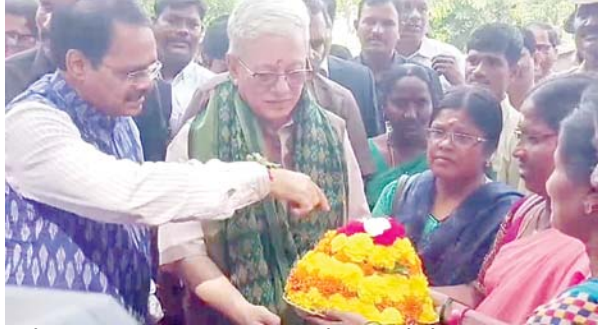
ప్రత్యేక ప్రాముఖ్యతను సంతరించుకు నే తరహాలో దేవాలయాలు దానికి తోడు సంస్కృతి సాంప్రదాయాలు ప్రతిబింబించే కోలాటాలు, బోనాలు, బతుకమ్మలతో గవర్నర్ కు మహిళలు ఘన స్వాగతం పలికారు.