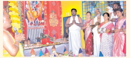
శ్రీ బాలాజీ వెంకటేశ్వర స్వామి ఆలయంలో శ్రీ లక్ష్మీ సుదర్శన మహా యజ్ఞం