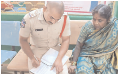
కొట్టిందని ఫిర్యాదు లో పేర్కొన్నారు. డ్రైవర్ అతివేగంగా, అజాగ్రత్తగా నడటమే ఇందుకు