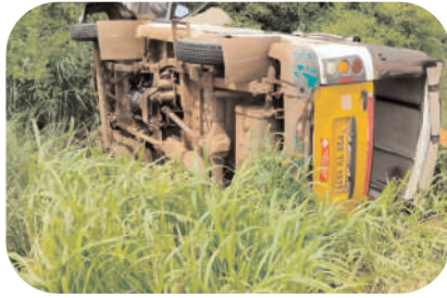
కారణమని, ఈ యాక్సిడెంట్ లో తనతో పాటు అందరూ గాయలపాలయ్యాయని ఫిర్యాదులో తెలిపారు. దీనిపై విచారణ జరిగి డ్రైవర్ గాస్ పై చర్యలు తీసుకోవాలని మర్నాటి ఎస్ఐ ని కోరారు.