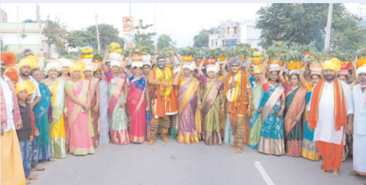
అమ్మవారి చల్లని చూపు ఎల్లప్పుడూ