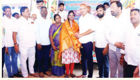
కాప్రా, ఆగస్టు 25 (జనంసాక్షి)