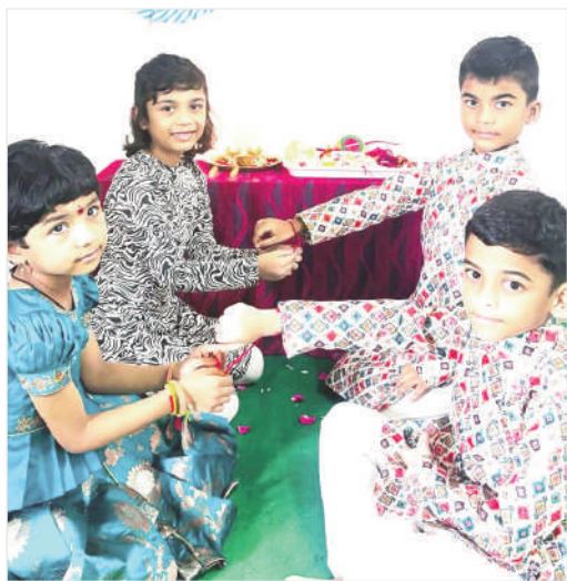
బుణం కూడ ఎక్కువే తీర్చుకోవాల్సి వస్తుంది, నా మందమరి ఆడపడుచులందరికి పాదాభివందనం అనుకున్నాను. కొందరికి పేరు, పేరున కృతజ్ఞతాపూర్వక జవాబు తో కాల్పులు కూడ రాసాను. ఆ రోజు నా జీవితం లో అద్భుతమైన రోజు, నేను నా

బహుశానే భాయి కె కలాయిపే ప్యారే బాండా హైద్రాబాద్ కి డోరినీ...ప్యాన్యే సోత్ సారా సంసారే బాండా హై! ఎన్ అదే రాఖీ! అన్న క్షేమాన్ని రక్షణ ను కోరుతూ ఒక సోదరి, సోదరుడికి చేతికి కట్టేదే పవిత్రమైనదే రాఖీ! అది రాను రాను ఫ్రెండ్స్ బాండ్ కూడ అయ్యింది. రాఖీ ఒక ఆత్మీయ, ప్రేమ, సోదరి, సోదరుల పరస్పర రక్షణకు ఒక పవిత్రమైన బంధం!