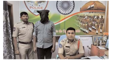
పాత ఇనుము దొంగ అరెస్ట్