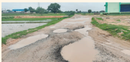
పీఎస్ఎస్ గోదాము సమీపంలో ఆర్ అండ్ బి రోడ్డు