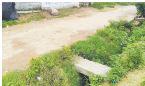
కొల్వారం జూలై 23 (జనం సాక్షి) కొల్వారం మండల కేంద్రంలోని పారిశుధ్యం పడకేసింది. వర్షాకాలం