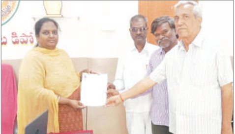
ట్రస్ట్ సభ్యులు నారాయణపేట జిల్లా బ్యూరో (జనం సాక్షి):