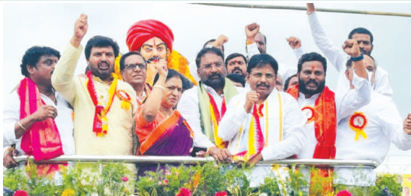
మహబూబ్ నగర్ జూలై 17 (జనం సాక్షి)

నిరుపేదల పక్షాన అలుపెరుగని పోరాటం చేసిన పేదల ఆశాజ్యోతి, అట్టడుగు వర్గాల ఆత్మ బంధు