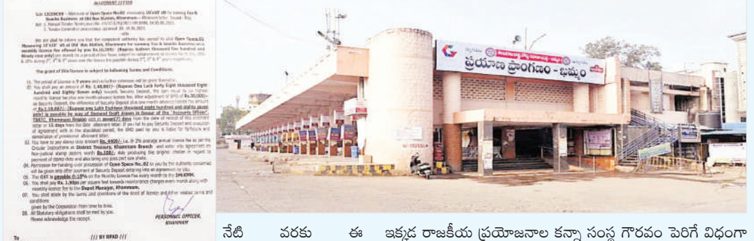
నేటి వరకు ఈ విషయంలో ఎటువంటి కదలిక లేదు. ఈ లెటర్ చేసిన నాటి నుండి 15 రోజుల్లోగా ఒక్కొక్క జరిగిపోయిన ప్రక్రియ పూర్తిగా ఆగిపోయింది అని చెప్పాలి. అయితే ఇది ఆగటం వెనుక నాటి ప్రభుత్వంలోని పెద్ద హాస్సు ఉన్నట్లు ఆరోపణలు ఉన్నాయి. కేవలం ఓటు బ్యాంకు కోసమే దుకాణాలు ఏర్పాటు చేయకుండా కొంతమందికి లబ్ధి చేకూరేందుకు ప్రయత్నించినట్లు తెలుస్తోంది. ప్రభుత్వం దుకాణా టెండర్ల దక్కించుకున్న దుకాణదారులు తీవ్ర మనోచేదనకు గురవుతున్నారు. త్వరలోనే ఈ విషయంపై జిల్లా మంత్రులు జోక్యం చేసుకొని తమకు న్యాయం చేయాలని కోరుతున్నారు.