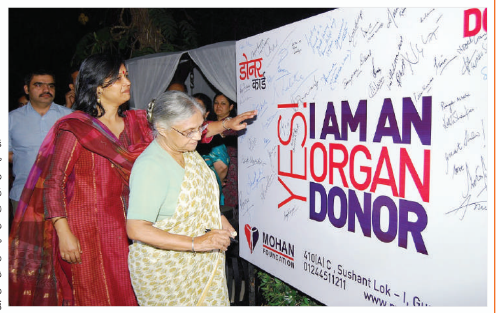
అర్ధన దోనరేషన్ కోసం రిజిస్టర్ చేయించుకున్న కార్డ్ తీసి నాన్న చేతిలో పెట్టాను. ఏమిటి రా ఇందరా అంటూ విశ్రాంతిగా చూశారు నా వేపు.