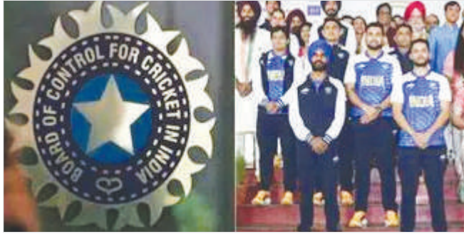
మహిళలు, 70 మంది పురుషులు ఉన్నారు. ట్రాక్ విభాగంలోనే అత్యధికంగా 29 మంది పోటీ పడుతుండగా.. 21 మంది మాటర్లు ఒలింపిక్ పతకంపై గురి పెట్టారు. జూలై 26వ తేదీన ఒలింపిక్స్ పోటీలు అట్లహాసంగా ప్రారంభం కానున్నాయి.

భారత క్రికెట్ నియంత్రణ మండలి మరోసారి తన ఉదారత చాటుకుంది. పొట్టి ప్రపంచ కప్ విజేతలకు రూ.125 కోట్లు ప్రైవేటు ప్రకటించిన బీసీసీఐ ప్యాంప్లీ ఒలింపిక్స్లో పాల్గొంటున్న భారత అథ్లెట్లతో ఉత్సాహం నింపేందుకు కీలక నిర్ణయం తీసుకుంది. విశ్వ క్రీడల్లో పోటీపడుతున్న అటాథ్లెట్లకు ఆర్థిక సాయంగా భారత ఒలింపిక్ సంఘం(%సూచా%)నికి రూ.8.5 కోట్లు ఇవ్వనుంది. ఈ విషయాన్ని ఆదివారం బీసీసీఐ సెక్రటరీ జై షా ఎక్స్ వేదికగా వెల్లడించాడు. 'ప్యాంప్లీ ఒలింపిక్స్లో పాల్గొంటున్న భారత బృందానికి బీసీసీఐ ఆర్థిక సాయం చేస్తుందని చెప్పడానికి నేను ఎంతో సంతోషిస్తున్నా. విశ్వ క్రీడల సందర్భంగా భారత ఒలింపిక్ సంఘానికి రూ.8.5 కోట్లు అందజేస్తున్నాం. మెగా టోర్నీలో తలపడనున్న అథ్లెట్లకు ఆర్ డి జెస్ట్. భారతదేశం గర్వపడేలా చేయడం. జై హింద్ అని షా తన ఎక్స్ థా పోస్ట్లో అన్నాడు. నిరుడు ఆసియా క్రీడల్లో పతక వందనం చేసిన భారత బృందం ఒలింపిక్స్లోనూ మెరిసేందుకు సిద్ధమైంది. ఈసారి 117 మందితో కూడిన స్క్వాడ్ ప్యాంప్లీకి వెళ్లింది. ఇందులో 47 మంది