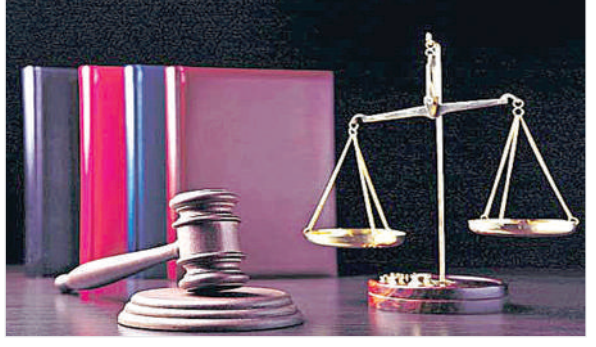
కేసుల సత్వర పరిష్కారం

మధ్యవర్తిత్వ అంగణ నిష్పక్షితక తట్టు మధ్యవర్తి ద్వారా తగాదా పడే వ్యక్తులు బిచ్చికంగా సహకరించుకొని వివాదాలను పరిష్కరించుకొనే ఒక ప్రక్రియ. ఈ ప్రక్రియలో మధ్యవర్తి తన నిర్ణయం కచ్చితంగా కక్షిదారులపై రద్దుకుండా తగాదాపడే వ్యక్తులు తమ తగవులను పరిష్కరించుకొనడానికి అనుకూల వాతావరణం కల్పిస్తాడు. మధ్యవర్తిత్వ ప్రక్రియ ప్రత్యామ్నాయ వివాద పరిష్కార పద్ధతిగా విజయం సాధించింది. బెంగళూరు చెన్నయ్ లాంటి నగరాలలో ఈ ప్రక్రియ గొప్ప విజయం సాధించింది. మధ్యవర్తిత్వంలో పాల్గొన్న కక్షిదారులు ఈ విధానాన్ని స్వాగతించారు. అందరూ ఆమోదించారు. అంగీకరించారు. ఈ విధానంలో కక్షిదారులు తమ సమస్యలను తామే పరిష్కరించుకునే అవకాశం వుంటుంది.