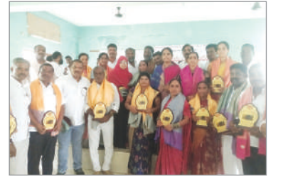
మండల ప్రజా పరిషత్ కార్యాలయంలో సాధారణ సుర్వసభ్య సమావేశం ముఖ్యఅతిథిగా హాజరైన సర్కార్ ఎమ్మెల్యే