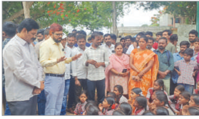
ఇద్దరు ఉపాధ్యాయులను పంపిస్తామన్న ఎంకూఓ