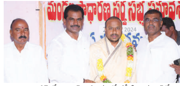
ఎమ్మెల్యే శాఖలపై అధికారులతో సమీక్షించారు. 7లో..