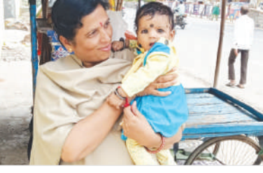
వెళ్ళుతున్న లాలించగా చిన్నారి ముని ముని నవ్వులు నవ్వంది.

గ్రూప్-1 ప్రలిమినరీ పరీక్ష కేంద్రం వద్ద మహిళా పోలీసు మాతృత్వం చాటుకుంది. సంగారెడ్డిలోని కరుణ హై స్కూల్, పరీక్షా కేంద్రానికి గ్రూప్-1 ప్రలిమినరీ పరీక్ష రాయదానికి తన కూతురును వదిలేసి వెళ్ళింది. కొద్దిసేపు తర్వాత పాప రోదీస్తున్న ది గమనించిన మహిళా పోలీస్ చిన్నారిని