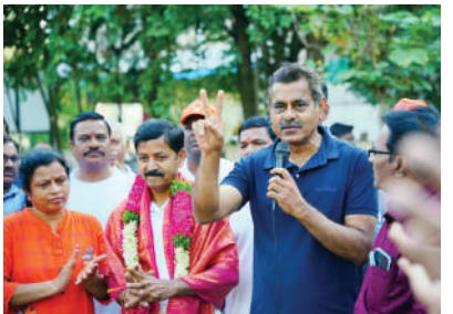
తొలిసారి ఓటహక్కును వినియోగించుకోతున్న యువతీ, యువకులు తమ అమూల్యమైన ఓటును దేశానికి గర్వకారణంగా నిలుస్తున్న నరేంద్ర మోదీకి మాత్రమే వేయాలని కోరారు.

హైదరాబాద్, 3 మే (జనంసాక్షి) : 2047 నాటికి భారతదేశాన్ని ప్రపంచంలో అగ్ర భాగం నిలపడమే ప్రధాని నరేంద్ర మోదీ లక్ష్యమన్నారు చేపట్టిన అభ్యర్థి కొండా విశ్వేశ్వర్ రెడ్డి. ఎన్నికల ప్రచారంలో భాగంగా ఆయన రాజేంద్రనగర్ నియోజకవర్గం అత్తాపూర్ డివిజన్ లోని లక్ష్మీనగర్ పార్క్ లో మార్నింగ్ వాక్ ను కలుసుకున్నారు. ఈ సందర్భంగా కొండా విశ్వేశ్వర్ రెడ్డి మాట్లాడుతూ.. దేశాభివృద్ధి కోసం అహర్నిశలు పాటుపడుతున్న ఏకైక నాయకుడు నరేంద్ర మోదీ మాత్రమేన్నారు. దేశాన్ని ఆర్థిక పథంలో నడుపుతున్న మోదీని మరోసారి ప్రధానిని చేయాల్సిన బాధ్యత ప్రజలందరిపై ఉందన్నారు.