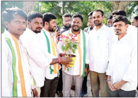
పటాన్చెరు, మే 4 (జనంసాక్షి)

• మధుని కలిసిన వివిధ సంఘాలు, అభిమానులు • అన్నివర్గాల నుంచి పెరుగుతున్న మద్దతు..