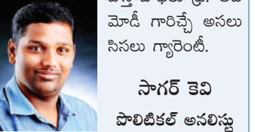
సాగర్ కెవి పాలిటికల్ అసెంబ్లీ

ఉద్యోగాలిచ్చే బటిబాటర్, బయ్యారం ఉక్కు కర్మాగారంలాంటి ప్రాజెక్టులకు ఇప్పటి వరకూ దిక్కే లేదు. హైదరాబాద్ లో మిల్లెట్ రీసర్చి సెంటర్ ఏర్పాటు, ములుగులో గిరిజన యూనివర్సిటీ ఏర్పాటుపై మాటిచ్చి పదేండ్లయినా ఇప్పటి వరకూ అతీగతీ లేదు. ఖాజీపేటలో రైల్వే కోచ్ ఫ్యాక్టరీని మోడీ సర్కార్ గుజరాత్ కు తరలించుకుపోయింది. రైల్వే శాఖకు అత్యధిక ఆదాయాన్ని అందిస్తున్న జోన్ లో దక్షిణ మధ్య రైల్వే ఒకటి. సికింద్రాబాద్ కేంద్రంగా ఉన్న ఈ జోన్ కు బడ్జెట్ కేటాయింపుల్లో అసలు ప్రాధాన్యతే లేకుండా పోయింది. రాష్ట్రంలో ఈ పదేండ్లలో ఒక్కటంటే ఒక్క జాతీయ పరిశ్రమను స్థాపించలేదు. నిజామాబాద్ పనులు బోర్డు కలగానే మిగిలిపోయింది. వరదల సమయంలో ప్రధాని మోడీ సొంత రాష్ట్రమైన గుజరాత్ కు నిధుల వరద పారించిన కేంద్రం... అకాల వర్షాలతో అతలాకుతలమైన హైదరాబాద్ కు నయా పైసా ఇవ్వలేదు. హైదరాబాద్ లో నిర్మించవలసిన అంతర్జాతీయ మధ్యవర్తిత్వ కేంద్రం (ఆర్పిట్రోషన్ సెంటర్) ఏర్పాటుకు పైసా ఇవ్వలేదు. బల్కే డ్రగ్ పార్క్ పథకానికి ఎన్నో అనుకూలతలున్నప్పటికీ తెలంగాణకు ఇవ్వకుండా కేంద్రం వెన్నుపోటు పొడిచింది. భారీ గా లాభాలు గడిస్తున్న సింగరేణికి బొగ్గు గనులు కేటాయించకుండా ఆ సంస్థను ప్రయివేటీకరించేందుకు బీజేపీ ప్రభుత్వం కుట్రలు పన్నుతున్నది. ఈ నేపథ్యంలో అసలు బీజేపీ మూడోసారి అధికారంలోకి వస్తే... దేశంలోనూ, రాష్ట్రంలోనూ ప్రజలు సుఖంగా జీవించగలుగుతారా..? వారి దైనిందిన సమస్యలు పరిష్కారమవుతాయా..? ఈ దేశం అభివృద్ధి చెందుతుందా..? అంటే ఎట్టి పరిస్థితుల్లోనూ కాదు. అందుకే బీజేపీ వస్తే బాధలు ప్రీ. అదే మోడీ గారిచ్చే అసలు సిసలు గ్యారంటీ.