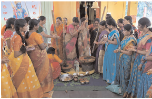
రక్షాబంధనం, అంకూర్పారణ మోమం నిర్వహించారు. అనంతరం భక్తులకు తీర్థప్రసాదాలను పంపిణీ చేశారు. అలాగే

ఏటూరునాగారం, ఏప్రిల్ 16(జనంసాక్షి) : మండల కేంద్రంలోని శ్రీ సీతారామచంద్రస్వామి ఆలయంలో మంగళవారం పసుపు దంచుట కార్యక్రమం అంగరంగా వైభవంగా జరిగింది. ఈనెల 17వ తేదీన శ్రీ సీతారాముల కల్యాణ మహోత్సవం సందర్భంగా కల్యాణ వేడుకల్లో భాగంగా గ్రామంలోని మహిళలు పెద్ద ఎత్తున హాజరై పసుపుకొమ్ములను దంచి పసుపు, బియ్యంతో తలంబ్రాలను తయారు చేశారు. ఉదయం అడవి నుంచి పాలపొరకను తీసుకువచ్చి రామాలయంలో ఏర్పాటు చేసిన పచ్చని పందిరిపై కమిటీ సభ్యులు, గ్రామస్తులు, మహిళలు అలంకరించారు. అనంతరం నిత్యరాధణ, ఆభిషేకం, ఆరగింపు, పుణ్యహవచనం,