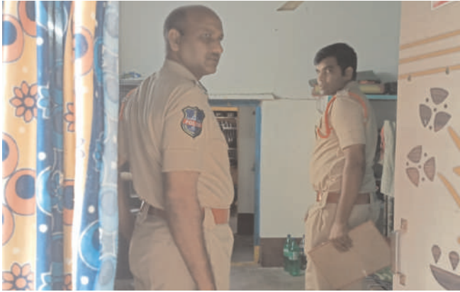
చొరబడి తలుపులు, బీరువా తాళాలు పగులగొట్టి బీరువాలోని 3 తులాల బంగారం, 10 తులాల వెండి