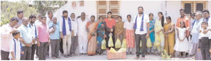
అంబేద్కర్ ఆశయ సాధన కమిటీ ఆధ్వర్యంలో పండ్లు, బ్రెడ్లు పంపిణీ