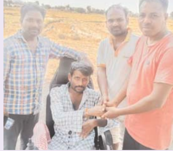
నిమిత్తం వారికి అండగా ఉండేందుకు స్నేహితులంతా సహకరించాలని కోరారు.