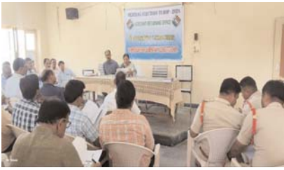
అగ్ని పోలింగ్ కేంద్రాల్లో