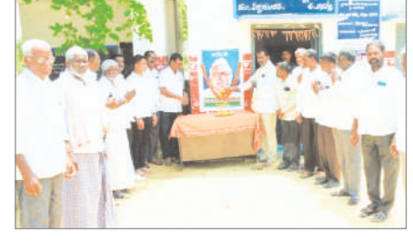
వనపర్తి బ్యూరో ఏప్రిల్ 05 (జనంసాక్షి)