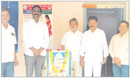
నారాయణపేట జిల్లా బ్యూరో (జనం సాక్షి):