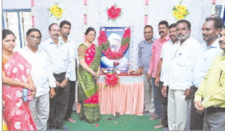
నారాయణపేట జిల్లా బ్యూరో (జనం సాక్షి):