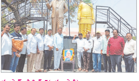
తూప్రాన్, ఏప్రిల్ 5 (జనం సాక్షి):