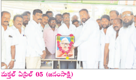
మక్కల్ ఏప్రిల్ 05 (జనంసాక్షి)