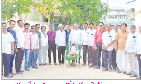
నారాయణపేట జిల్లా బ్యూరో (జనం సాక్షి):