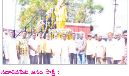
సదాశివపేట జనం సాక్షి :