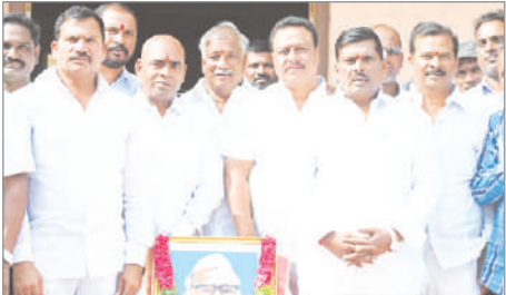
పటాన్చెరు ఏప్రిల్ 5 (జనం సాక్షి)