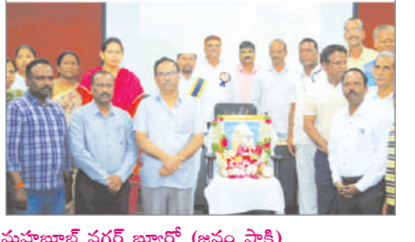
మహబూబ్ నగర్ బ్యూరో (జనం సాక్షి)