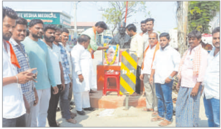
నారాయణపేట మండలం (జనం సాక్షి):