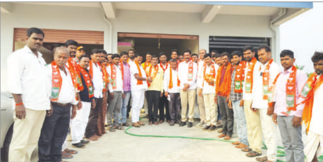
కృష్ణ ఏప్రిల్ 21 (జనం సాక్షి) మండలం ట్రైబోర్డులో మండలంలోని 29 మంది బీజేపీ బూత్ అధ్యక్షులు