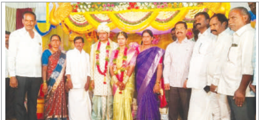
నారాయణపేట జిల్లా బ్యూరో(జనం సాక్షి): నారాయణపేట జిల్లాలో ఆదివారం బిఆర్ఎస్ జిల్లా అధ్యక్షుడు మాజీ ఎమ్మెల్యే ఎస్.రాజేందర్ రెడ్డి పలు శుభ కార్యాలలో పాల్గొని నూతన దంపతులను ఆశీర్వదించారు.

ఎదిగామన్నారు. తన వెంచర్ పై ఎమ్మెల్యే లేనిపోని ఆరోపణలు చేస్తున్నారని ఇది తిరిగి రిపీట్ అయితే పరువు నష్టం ధావ వేస్తామని ఆయన స్పష్టం చేశారు. జడ్చర్ల ఎమ్మెల్యే ఇలా దిగజారుడు రాజకీయాలు చేయడం పద్ధతి కాదన్నారు. అనంతరం బీఆర్ఎస్ పార్టీ నాయకులు ప్రణీత చంద్ర మాట్లాడుతూ 1956లో గంగోజీ కుటుంబానికి అసైన్మెంట్ పట్టా ఇవ్వడం జరిగిందన్నారు. రికార్డు ఉన్నది కాబట్టి ఎన్ ఓసికి అప్పై చేసుకొని సేల్ డీడ్ ద్వారా అమ్మడం జరిగిందన్నారు. ఉన్నతధికారులను ఎమ్మెల్యే అనిరుద్ రెడ్డి తప్పుదోవ పటస్తున్నారని ఆయన ఆరోపించారు. పట్టా భూమిలో 1.34 గుంటలు కావాలని ఇరిగేషన్ అధికారులు అంటే తాము రెండు ఎకరాల 7 గుంటల భూమిని విడివిడపట్టామని పేర్కొన్నారు. ఎంపీ ఎలక్షన్ కు ఫండే కోసం రియల్ ఎస్టేట్ వ్యాపారులను ఇబ్బంది పెడుతున్నారని ఆయన ఆవేదన వ్యక్తం చేశారు. ఎందుకు ఈ భూమిపై ఎమ్మెల్యే కక్ష కట్టారో చెప్పాలని, లేదంటే ముఖ్యమంత్రి ఇంటికి వెళ్లి సమస్యను పరిష్కరించుకుంటామని వారు పేర్కొన్నారు.