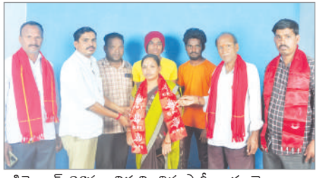
డిసెంబర్ 26న ఆవిర్భవించిన పార్టీ నాడు తెలంగాణ రైతంగ సాయుధ పోరాటానికి నాయకత్వం వహించి దున్నేవాడికే భూమి దక్కాలని 10 లక్షల ఎకరాల భూమి పేదలకు పంచి 4500 మంది కమ్యూనిస్టులు రక్త తర్పణం చేసిన ఘనమైన చరిత్ర సీపీఐకే